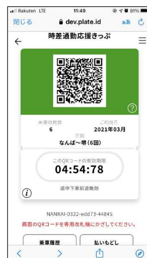
入場する際の画面