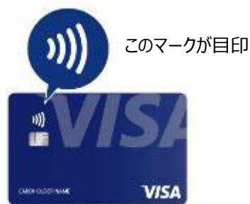
〔対応カードの一例〕

バス車載運賃箱に、Visa のタッチ決済の読取機器を設置します。Visa のタッチ決済に対応したカード（クレジット、プリペイド、デビット）をかざしていただくことで運賃をお支払いいただけます。大人運賃及び小児運賃に対応しています。