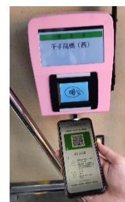
南海りんかんバス 利用イメージ