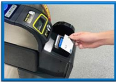
(入場時に専用端末へタッチ)