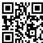
企画乗車券のイメージ 神姫バス