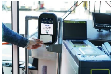
専用機器（イメージ）

江ノ島電鉄グループは今回の取り組みにより、今後更なる回復が見込まれるインバウンドの方々を中心に、公共交通をご利用いただく方々の利便性向上を図ります。