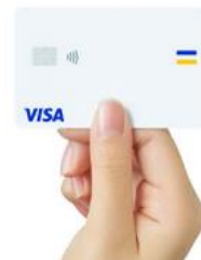
Visa のタッチ決済対応カード