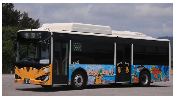
（世界自然遺産ラッピングバス）

西表島交通が運行する路線バスは、世界自然遺産に登録されている西表島の北西部の白浜と東南部の豊原の間を結ぶ路線バスで日本最南端を運行しています。西表島は年間約 30 万人の観光客が来訪する島であり、今般、西表島交通の路線バスが国際ブランドのタッチ決済に対応することにより、カードやスマートフォン等を読み取端末にかざすだけでバスに乗車可能となるため、観光客や地元のお客さまの利便性向上が図られます。