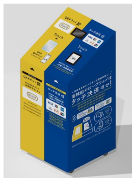
専用端末（イメージ）

小田急箱根グループでは、タッチ決済とQR チケットで周遊観光の環境整備を推進してまいります。なお、ロープウェイに国際ブランドのタッチ決済を導入するのは、全国初の取り組みです。