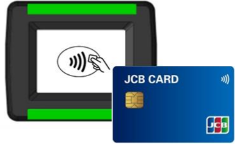
小田原機器社端末