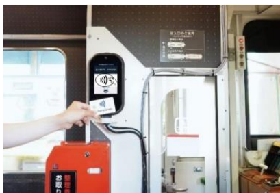
【専用読取端末機(レシップ社)】