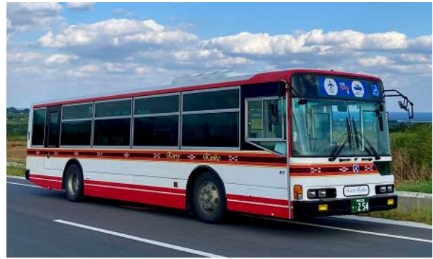
【カーリー観光が運行する路線バス】