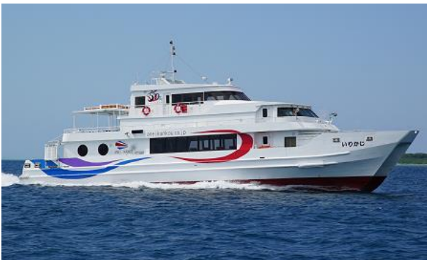
【安栄観光が運航する船舶】