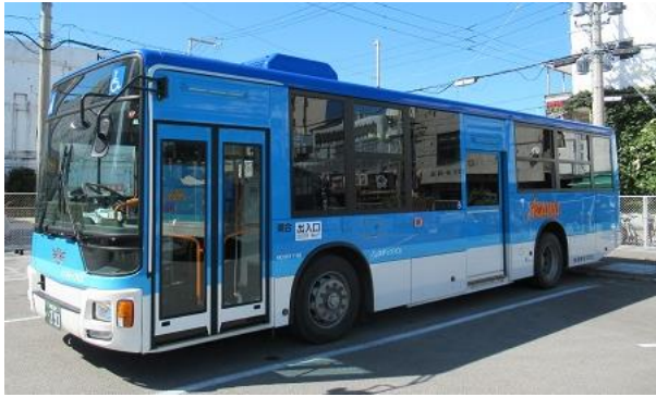
【東運輸が運行する路線バス】