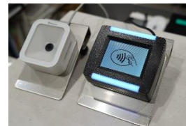
（出場時に専用端末にタッチ）