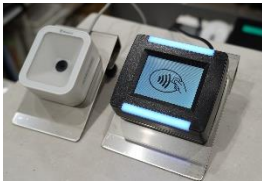
（入場時に専用端末にタッチ）