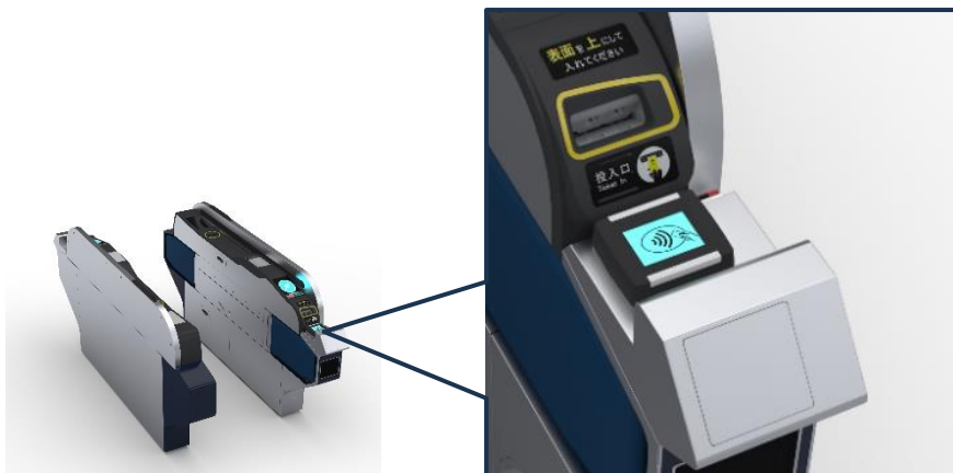
【自動改札機のイメージ】

実証実験の開始にあたり、札幌市営地下鉄全46駅の一部自動改札機にタッチ決済読取部を搭載します。