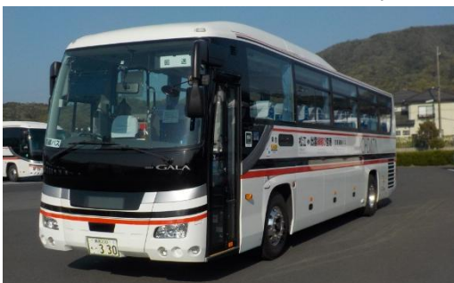
【松江一畑交通が運行する空港連絡バス】