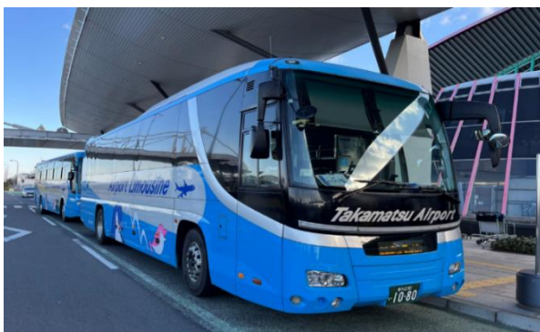
【ことでんバスが運行する高松空港リムジンバス】