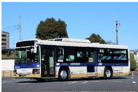
※導入車両（イメージ）

クレジットカード等によるタッチ決済は、三井住友カードが提供する公共交通機関向けソリューション「ステラトランジット」 ステラ を活用し、タッチ決済対応のカード（クレジット・デビット・プリペイド）や、同カードが設定されたスマートフォン等を、新たに運賃箱に設置する専用の端末にタッチすることでスムーズにご乗車いただけます。